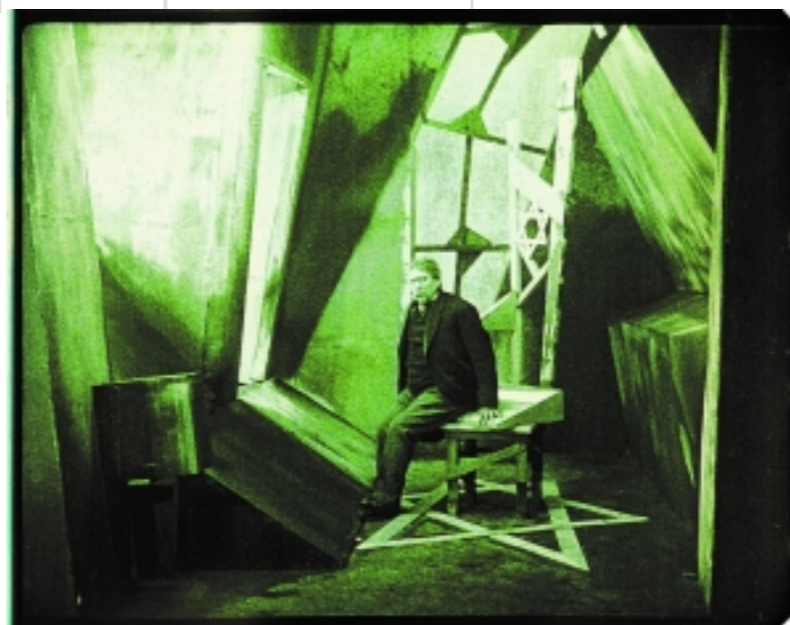
La Ville sans Juifs (1924) de Hans Karl Breslauer

Le festival L'Europe autour de l'Europe se déroule tous les ans au printemps à Paris. Pendant un mois il présente des films d'auteur et d'art de la Grande Europe (47 pays européens, membre du Conseil de l'Europe). Plus de cent films (long métrages, documentaires, films de court métrage, d'animation et expérimentaux) sont montrés dans une vingtaine de salles à Paris, où le public peut découvrir les chefs-d'œuvre cinématographiques européens récents et de patrimoine. Cette année le festival inaugure une collaboration avec la Fondation Jérôme Seydoux-Pathé. Dans le cadre d'un hommage au cinéma autrichien, la programmation sera dédiée aux films muets provenant du « Filmarchiv Austria » de Vienne.