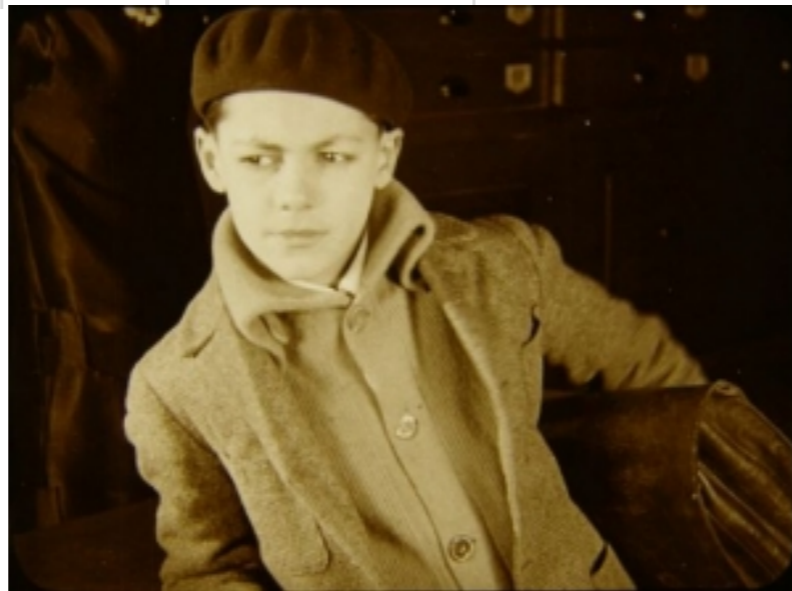
Photographie du film "Gribiche"