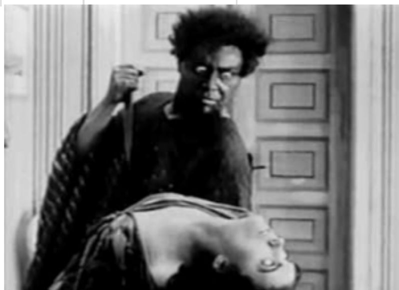
Les yeux de la Momie, droits réservés.

Plus connu du grand public pour ses « sophisticated comedies » comme Sérénade à trois ou To be or not to be ... ... Ernst Lubitsch a réalisé près d'une quarantaine de films avant son départ pour Hollywood en 1922. Des œuvres qui témoignent d'une inventivité déjà débordante et d'un esprit en constante ébullition. Le cycle « L'étonnant Monsieur Lubitsch ! » concocté par la Fondation Jérôme Seydoux-Pathé , en partenariat avec la Fondation F. W. Murnau, propose de revenir sur la période allemande de Ernst Lubitsch et les premiers pas d'un cinéaste, de bout en