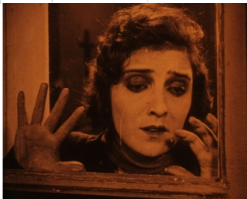
Der Bastard

La Fondation Jérôme Seydoux-Pathé présente une sélection de films muets sur le thème de l'immigration.