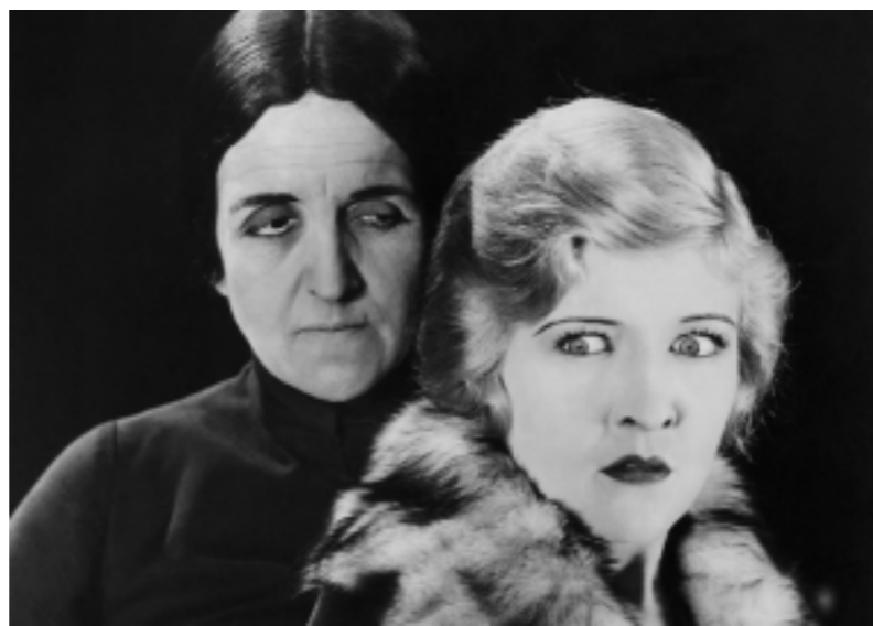
The Cat and the Canary

Pour commencer l'année 2019, la Fondation Jérôme Seydoux-Pathé célèbre les débuts de l'un des plus vieux studios de production et de distribution américain: les studios Universal .