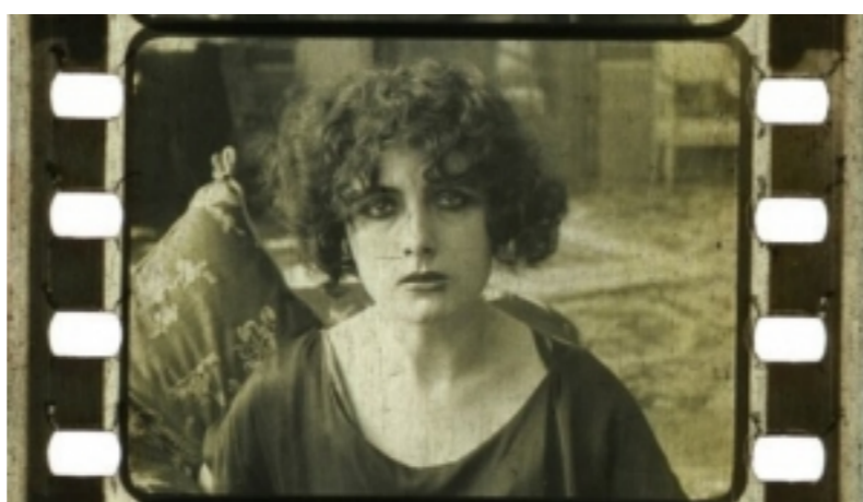
La Serpe