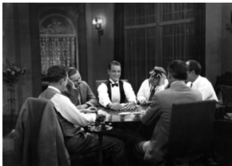
What Happened to Jones?

POUR TÉLÉCHARGER TOUTE LA PROGRAMMATION CLIQUER CI-DESSOUS TÉLÉCHARGER >