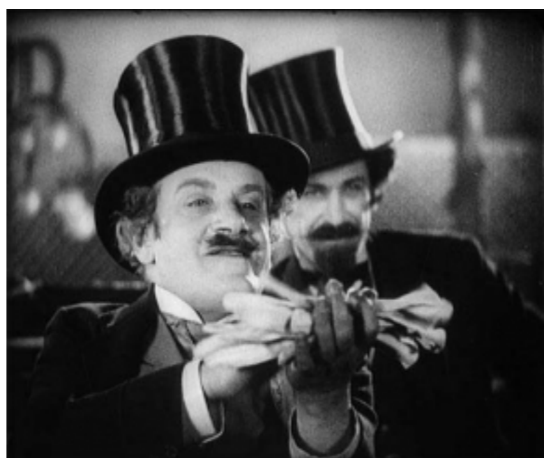
La Nouvelle Babylone, Kosintsev, Trauberg, 1929

POUR TÉLÉCHARGER LE PROGRAMME COMPLET, CLIQUER ICI ! TÉLÉCHARGER >