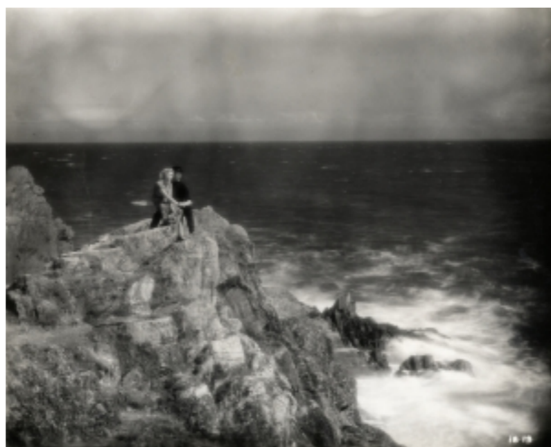
The man Xman