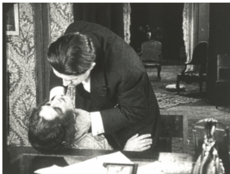
Le Silence de Louis Delluc

La Fondation Jérôme Seydoux-Pathé propose une nouvelle exploration du cinéma muet européen et américain, autour de l'art de voyager dans le temps. Procédés techniques et formels, trucs et effets spéciaux, animation ou prise de vue réelle, le cinéma découvre et élabore sa souplesse narrative et la mobilité temporelle qu'elle permet. Reconstituer le passé avec précision ou fantaisie, anticiper un avenir plus ou moins imaginaire, reparcourir l'évolution et les métamorphoses du monde et des hommes à travers les âges, confronter les époques et les civilisations : ce sont toutes ces facettes du voyage dans le temps que fait