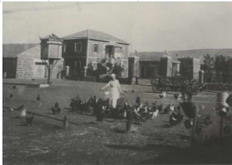
Shivat Zion

La Fondation Jérôme Seydoux-Pathé offre une carte blanche à la Cinémathèque de Jérusalem et à la Spielberg Jewish Film Archive. L'occasion pour les spectateurs parisiens d'avoir accès à un échantillon unique au monde de films muets - documentaires et fictions - tirés des archives cinématographiques israéliennes.