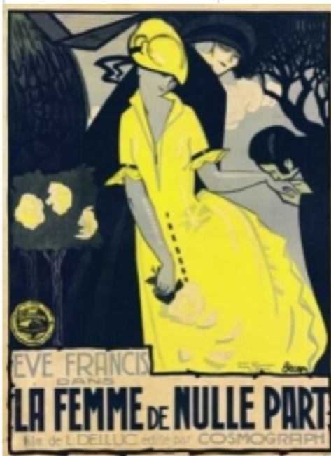
La Femme de nulle part, © droits réservés

Le Printemps continue à la Fondation Jérôme Seydoux-Pathé avec un cycle de films muets questionnant les tournages en studios et en décors naturels. Intérieur / Extérieur : inventions et déambulations dans l'espace. Entre possibilités techniques et imagination créatrice des réalisateurs, c'est un art nouveau qui s'invente et que le cycle reconstitue.